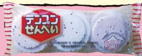
18枚入り(白9枚・赤9枚)1袋