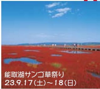
能取湖サンゴ草祭り 23.9.17(土)~18(日)