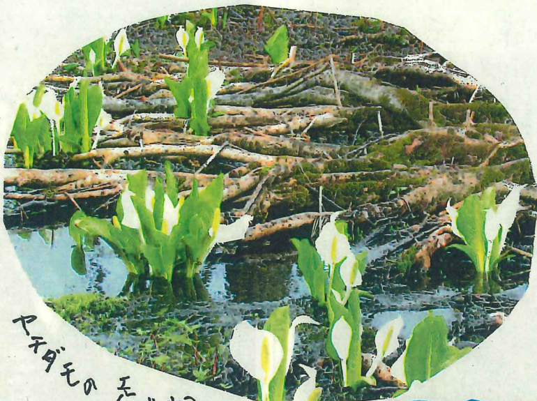
水芭蕉の走り根の中心